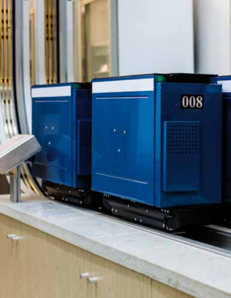
UniCar - 10 / 15 kg