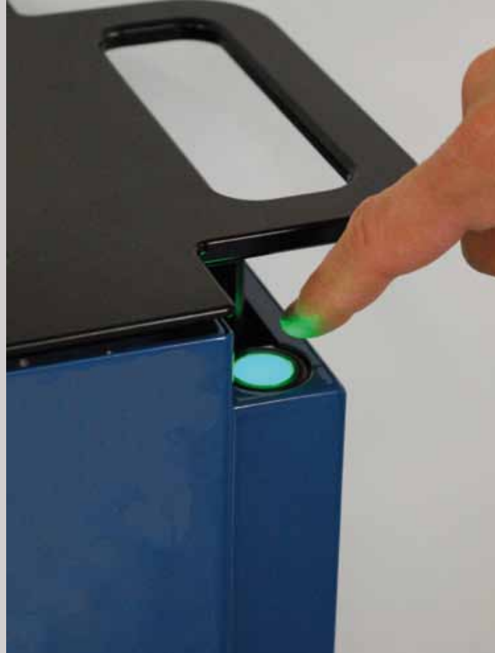
Telelift Systeme bieten Schutz