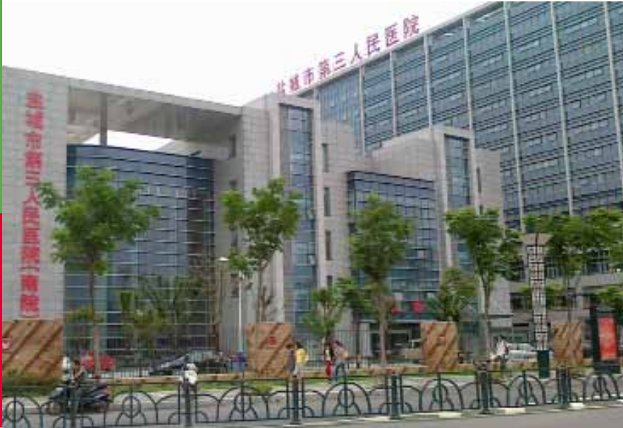
Yancheng No. 3 People's Hospital