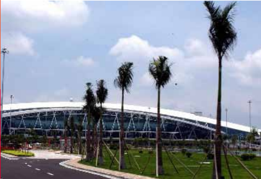
Air Cargo Center